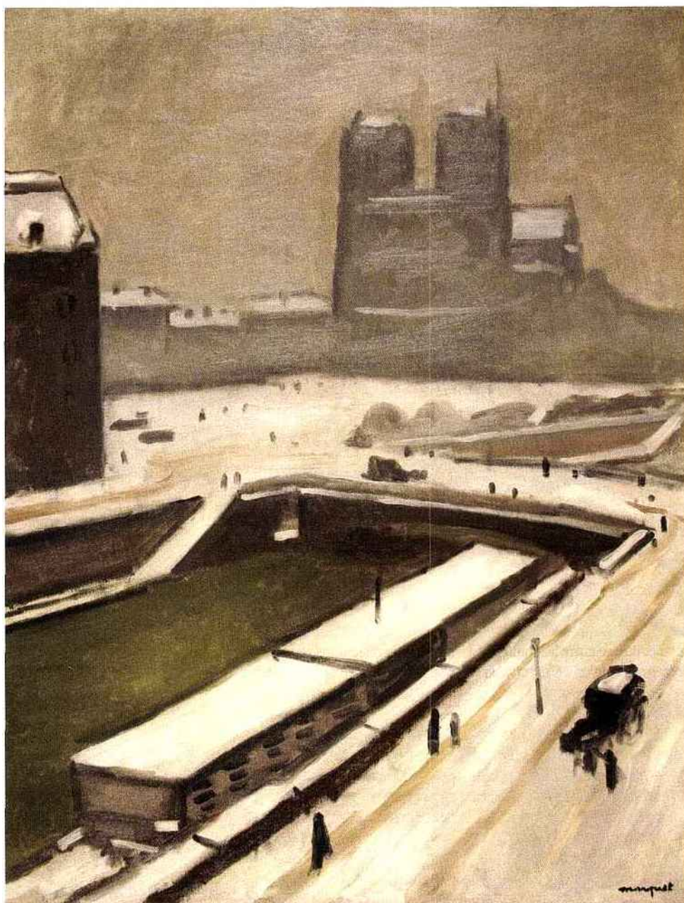
Albert Marquet, Notre Dame de Paris sous la neige , début 1916, huile sur toile, 81 x 64,8 cm.

Avec 18 galeries sur 84 exposants, la section moderne et contemporain est la mieux représentée