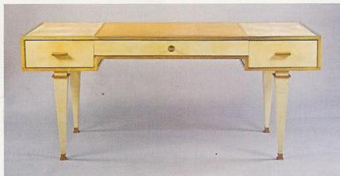
Marc du Plantier, bureau, vers 1936, parchemin et bronze doré, 100 x 200 cm (galerie Arnaud Plaisance, Paris).

E xit les antiquaires. Après quelques hésitations, le « Pavillon » change de nom. Baptisé à sa naissance « Pavillon des antiquaires », puis brièvement qualifié de « Pavillon Art et Antiques Fair », il devient enfin le « Pavillon des arts et du design ». Un patronyme qui en dit long sur la volonté des organisateurs et du comité de sélection.