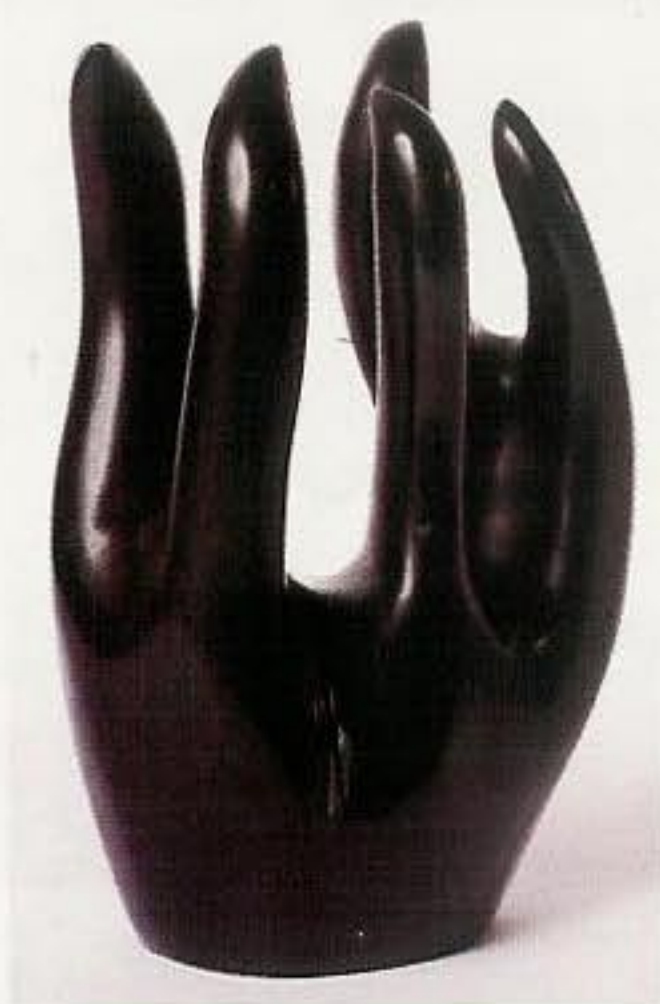
Alexandre Noll, Main , 1947, ébène, taille directe, H. 22 cm (galerie Jacques Lacoste, Paris).

Rebaptisé « Pavillon des arts et du design », le salon des Tuileries se concentre désormais sur le xx e siècle et ses sources.