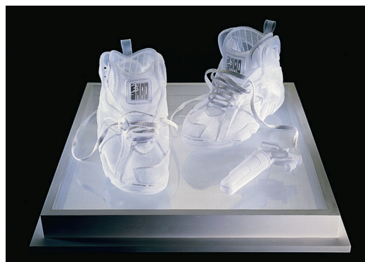
ANGÉLIQUE (NÉE EN 1957), SHAQ ATTAQ III, SCULPTURE SUR ORGANDI. © DR ANGÉLIQUE